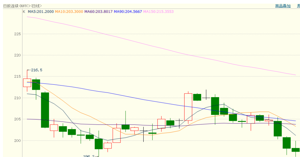
图 2、日胶连续 8 月 14 日行情走势