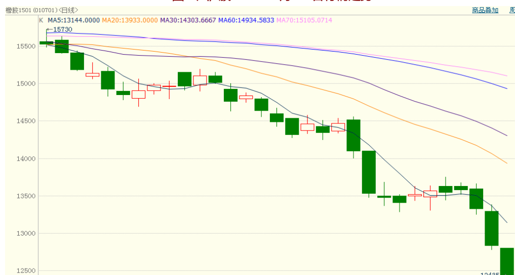
图 1、沪胶 1501 9 月 22 日行情走势