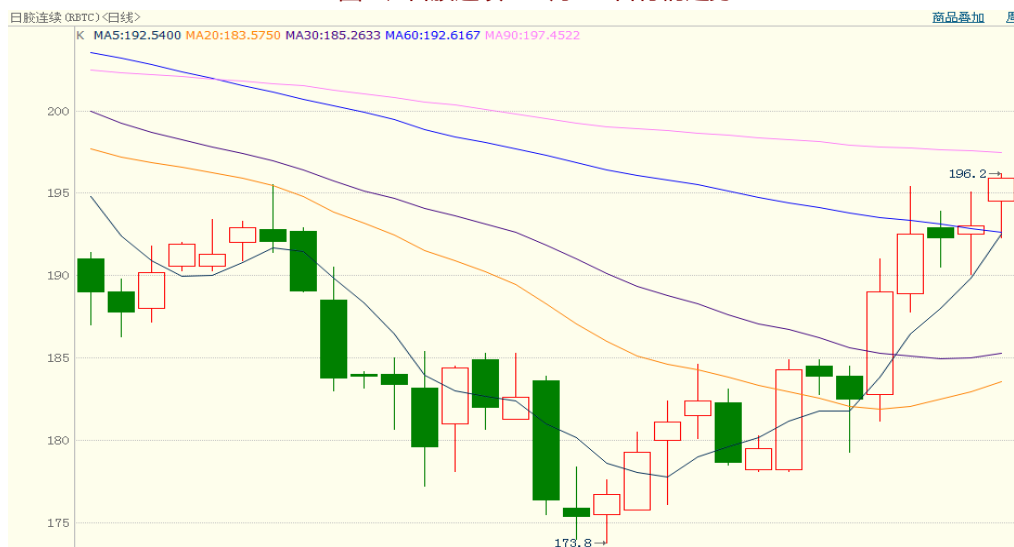
图 2、日胶连续 10 月 23 日行情走势