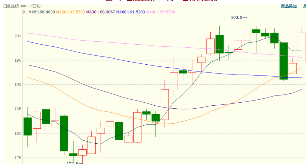
图 2、日胶连续 11 月 7 日行情走势