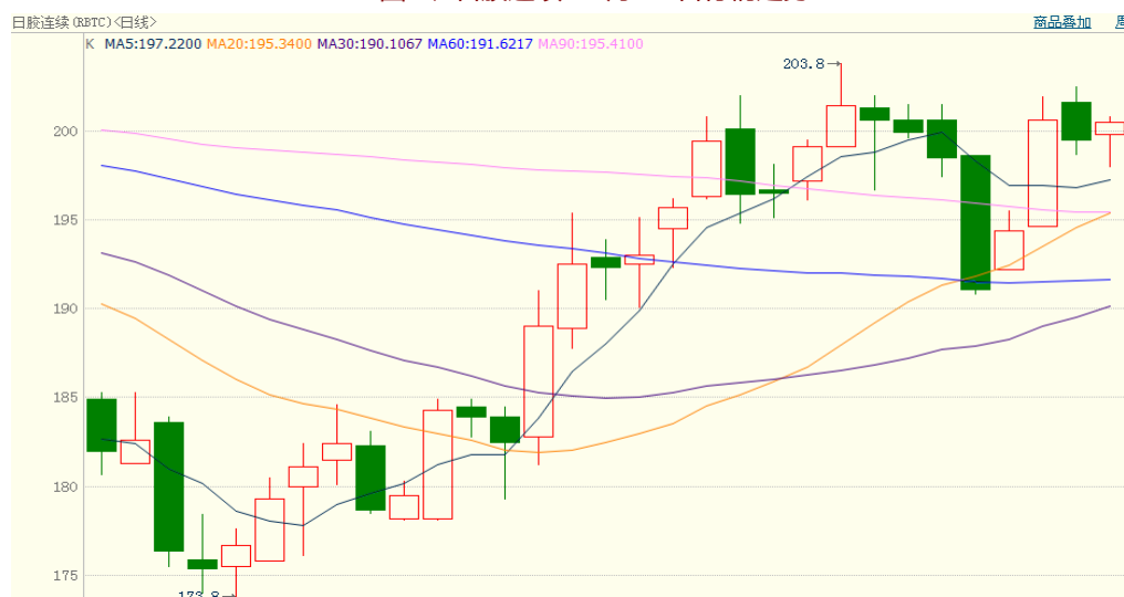
图 2、日胶连续 11 月 11 日行情走势