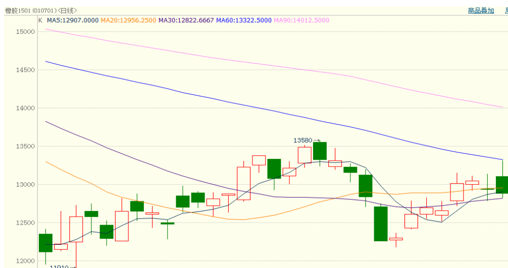
图 1、沪胶 1501 11 月 17 日行情走势