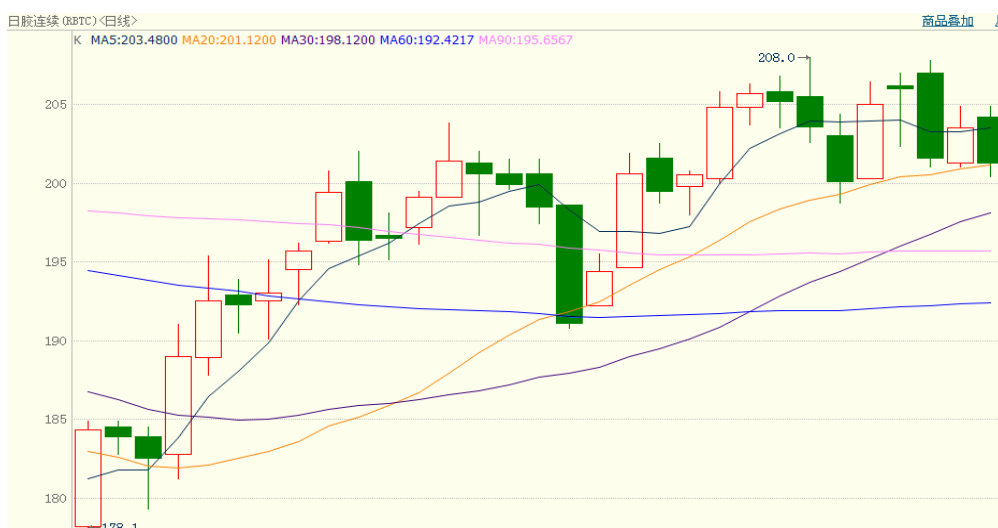
图 2、日胶连续 11 月 26 日行情走势