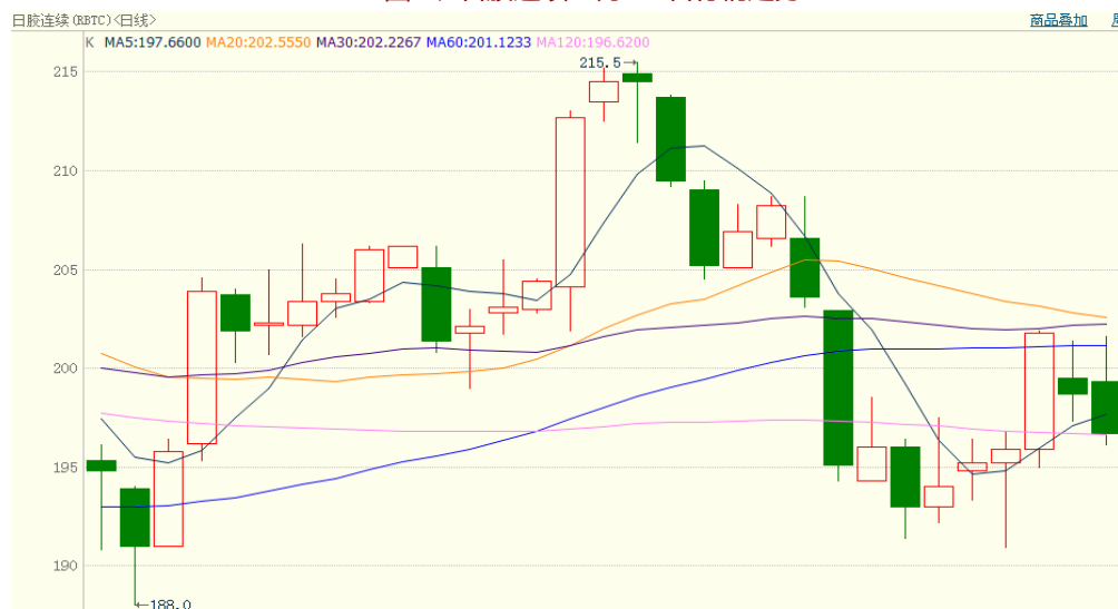
图 2、日胶连续 1 月 26 日行情走势