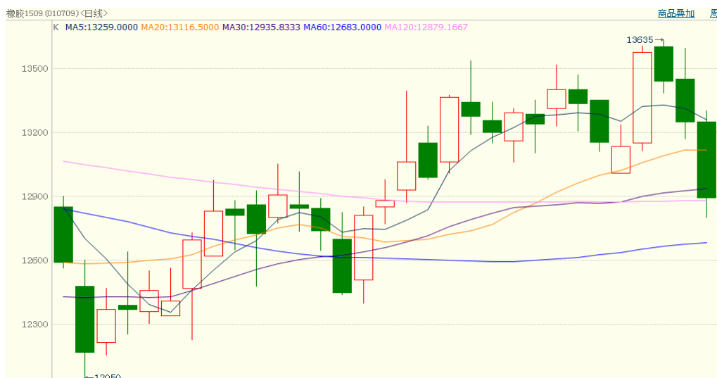
图 1、沪胶 1509 3 月 3 日行情走势