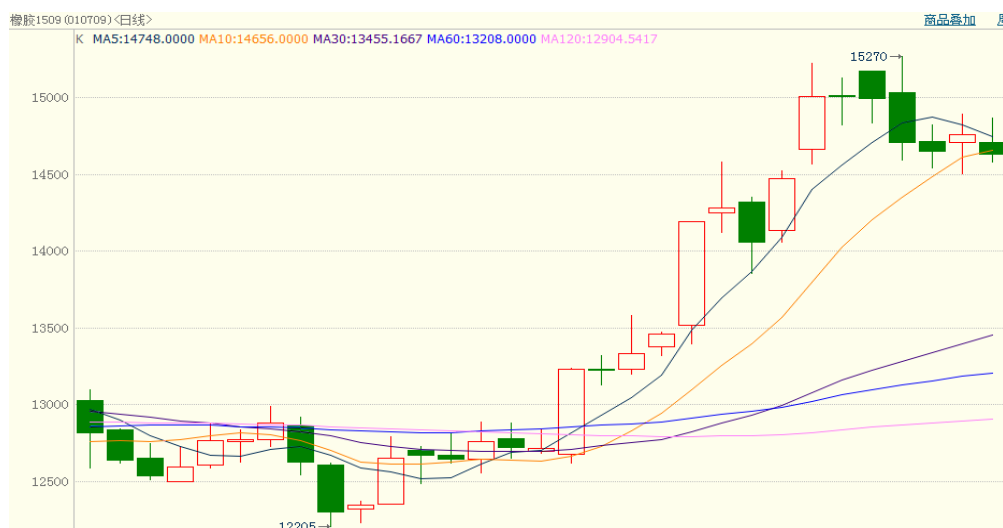
图 1、沪胶 1509 5 月 12 日行情走势