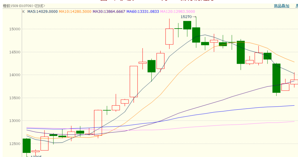
图 1、沪胶 1509 5 月 22 日行情走势