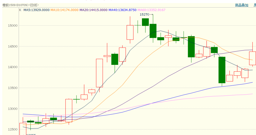
图 1、沪胶 1509 5 月 26 日行情走势