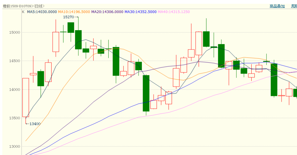
图 1、沪胶 1509 6 月 17 日行情走势