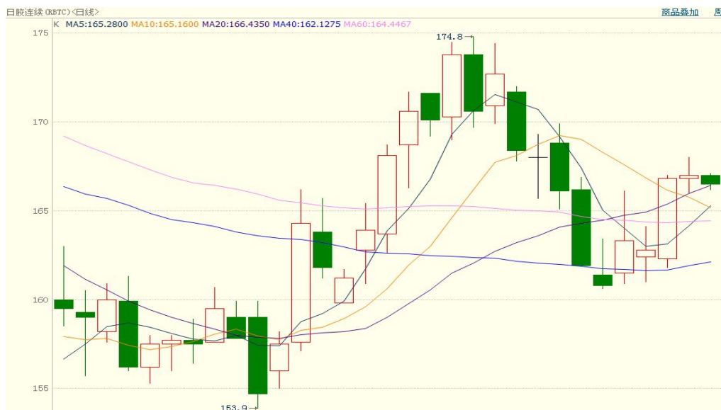
图 2、日胶连续 12 月 23 日行情走势