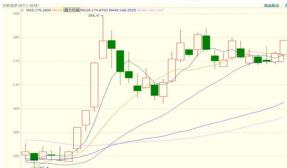
图 2、日胶连续 4 月 5 日行情走势